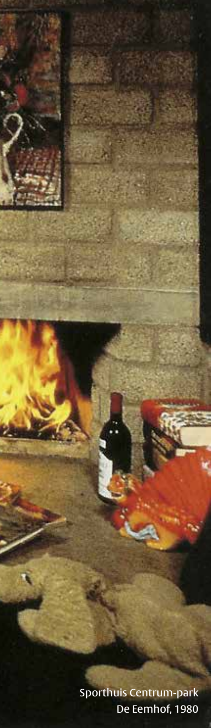
Sporthuis Centrum-park De Eemhof, 1980

'G A naar Norg,' heeft architectuur-historicus Mieke Dings aangera- den, 'om de oorsprong van onze vakantiehuusjes te begrijpen.' In mijn tas zit haar baksteendikke boek Tussen tent en villa , waarin ik lees over de socialistische Groningse coöperatie De Toekomst. Die wilde gezonde buitenlucht voor haar leden en kocht in 1931 à 7000 gulden een Drents bosterrein van zeven hectare, om een rust- en vakantieoord te stichten. Ze doopte het Den en Duin, en toen was het geld op. Met de verkoop van obligaties werden de tien- tjes bijengeharkt om ook nog te kunnen bouwen.