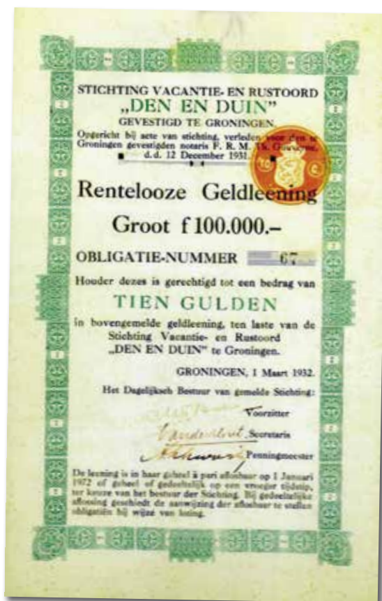
Den en Duin-obligatie