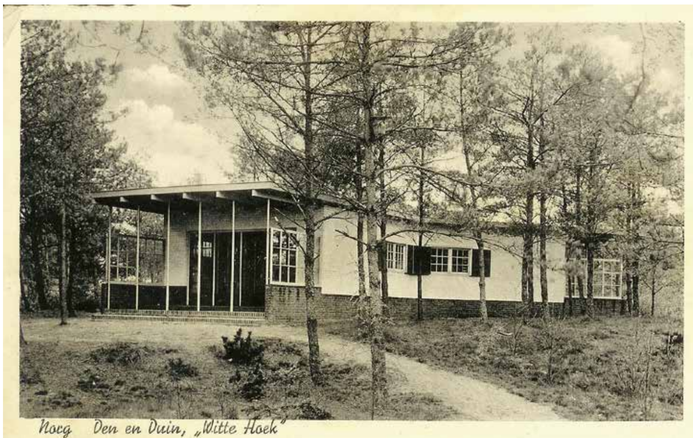
Norg Den en Duin, „Witte Hoek“

Door Groninger gemeente-architect S.J. Bouma ontworpen dubbel vakantiehuysje Witte Hoek van Den en Duin in Norg, 1942